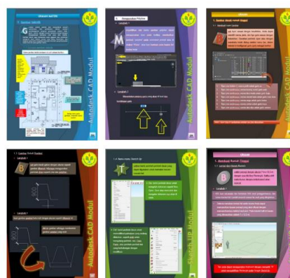
Gambar 1. Layout Modul