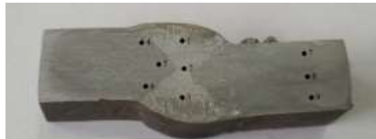
Gambar 5 Titik yang di uji keras padaspesimen non