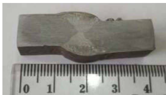
Gambar 3.7. Foto Struktur Makro Spesimen Non