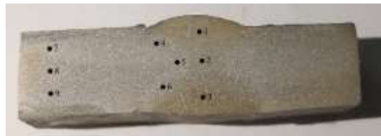
Gambar 4 Titik yang di uji keras padaspesimen krom