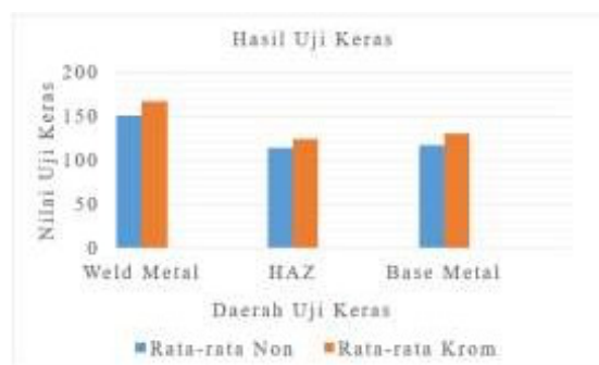
Gambar 6 Diagram Hasil Uji Keras

Pada daerah weld metal , nilai kekerasan spesimen krom lebih tinggi(166.8 VHN) dari pada nilai kekerasan spesimen non (150.97 VHN). Pada daerah HAZ, nilai kekerasan spesimen krom lebih tinggi (123.83 VHN) dari pada nilai kekerasan spesimen non (113.43 VHN). Pada daerah base metal , nilai kekerasanspesimen krom lebih tinggi (130.2 VHN) dari pada nilai kekerasan spesimen non dengan nilai rata-rata kekerasan (116.8 VHN). Untuk lebih jelasnya bisa dilihat pada Gambar 6.