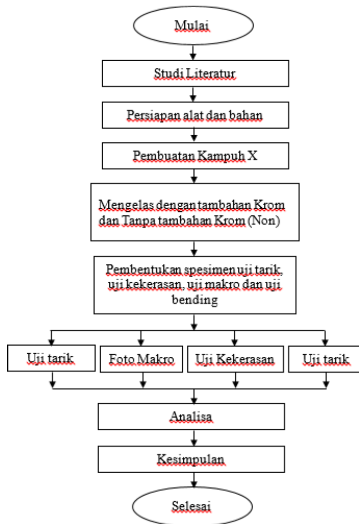
Gambar 1 Diagram Alir Penelitian