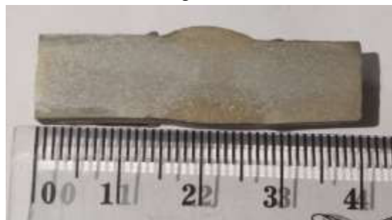
Gambar 3.6. Foto Struktur Makro Spesimen Krom

Pada uji foto struktur makro ini tujuan utama yang ingin dicapai yaitu mengetahui adanya daerah weld metal , daerah HAZ, dan daerah base metal pada sambungan material baja karbon rendah masing- masing spesimen. Berikut adalah hasil foto struktur makro pada masing-masing spesimen dengan menggunakan kamera handphone :